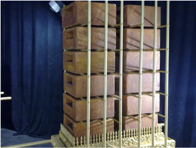
Røkelses alteret laget av bronse 45 cm x 45 cm og 1 m høyt.